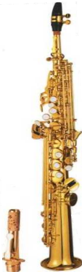
Modell TMB 15-2000

wie Modell 15-200 A, jedoch Antique Gold Finish €uro 640,-