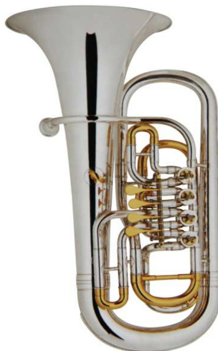
Modell Custom 4-61

ovale Bauart, 4 Ventile Bohrung 15 mm, Schall Ø 280 mm, doppelte Kugelgelenke €uro 890,-