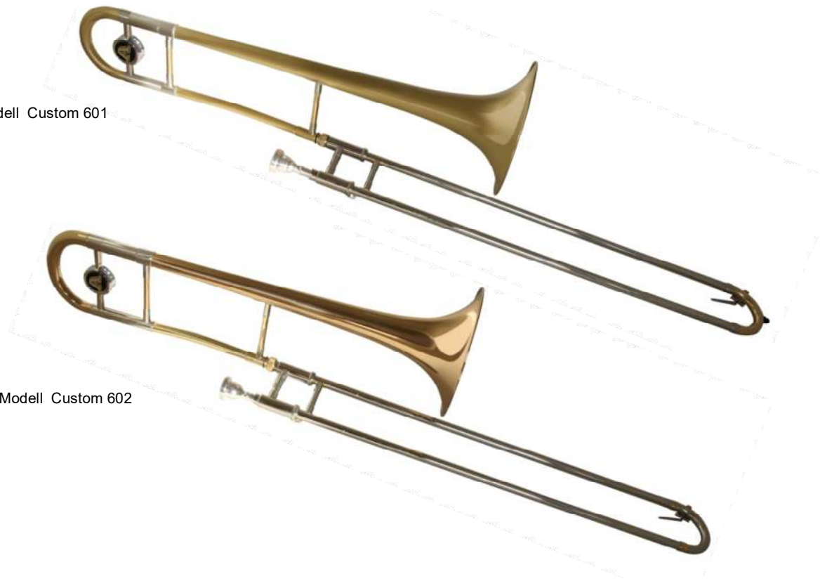
Modell Custom 602