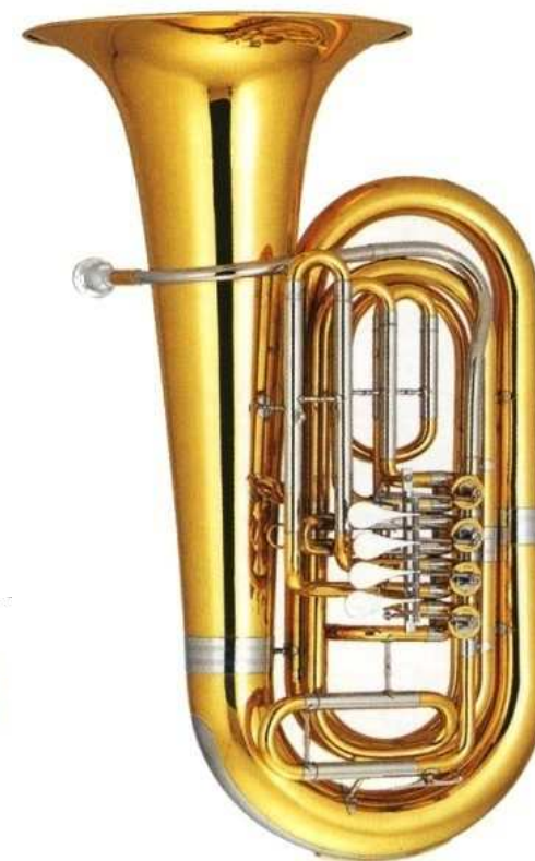
Modell TMB 125-00