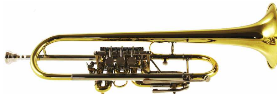
Modell TMB 2502