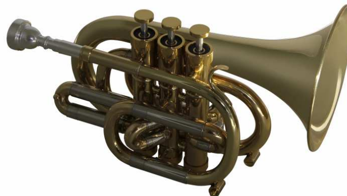
Modell Custom 15-408

Bohrung 11,7 mm, Schall Ø 125 mm, Monelventile €uro 380,-