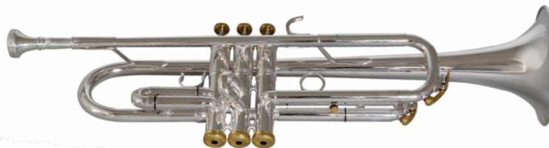
Modell Custom 1068

Aufwendige Verarbeitung und Materialien in versilbert. Runde Bögen gewähren beim Blasen wenig Widerstand. Reverse Mundrohr, Professionelle Ausführung, Stahlventile Bohrung 11,9 mm, Schallbecher Ø 125 mm €uro 960,-