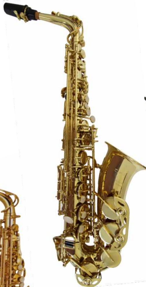
Modell TMB 14-2 AL