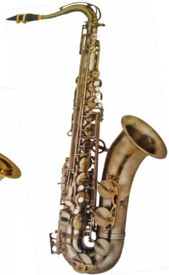
Modell TMB 15-200 TT