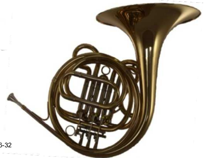
Modell TMB 146-32