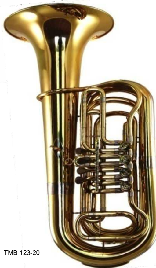
Modell TMB 123-20