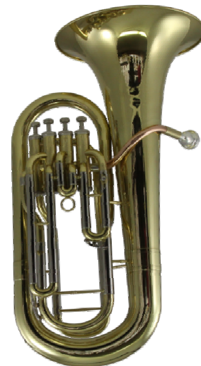
Modell TMB 108-15