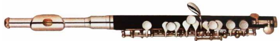
Modell TMB 15-1130