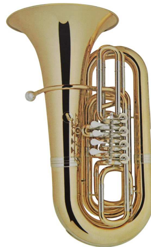
Modell Custom 300-30