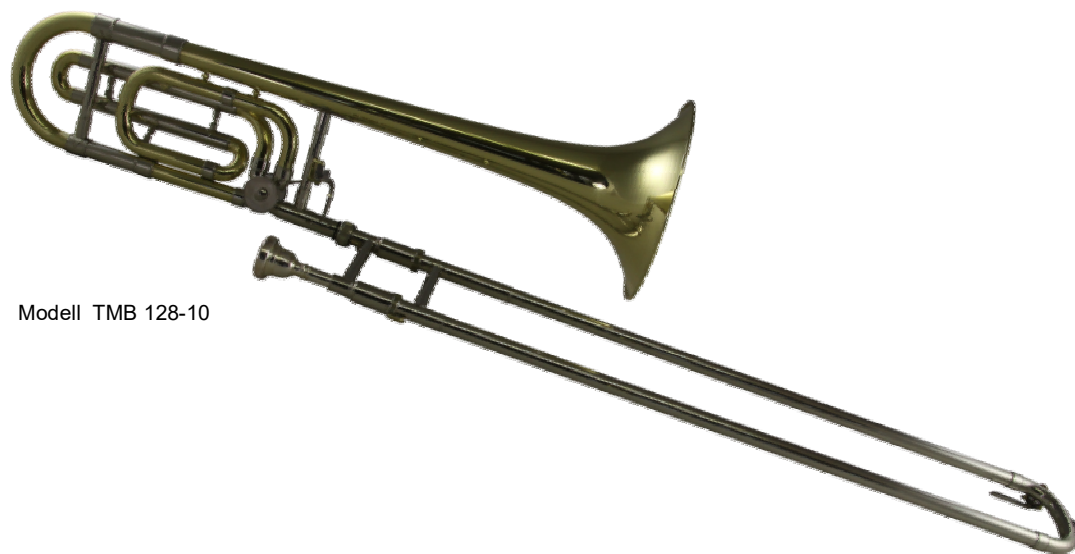
Modell TMB 128-10