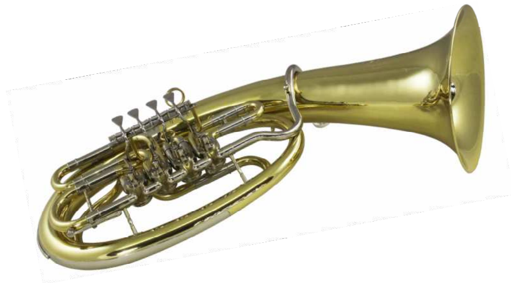
Modell TMB 121-60

Tubaform, 4 Ventile doppelte Kugelgelenke, konische Bohrung 15-16,8 mm, Schall Ø 300 mm, Ausführung lackiert €uro 1.390,- Ausführung versilbert €uro 1.640,-