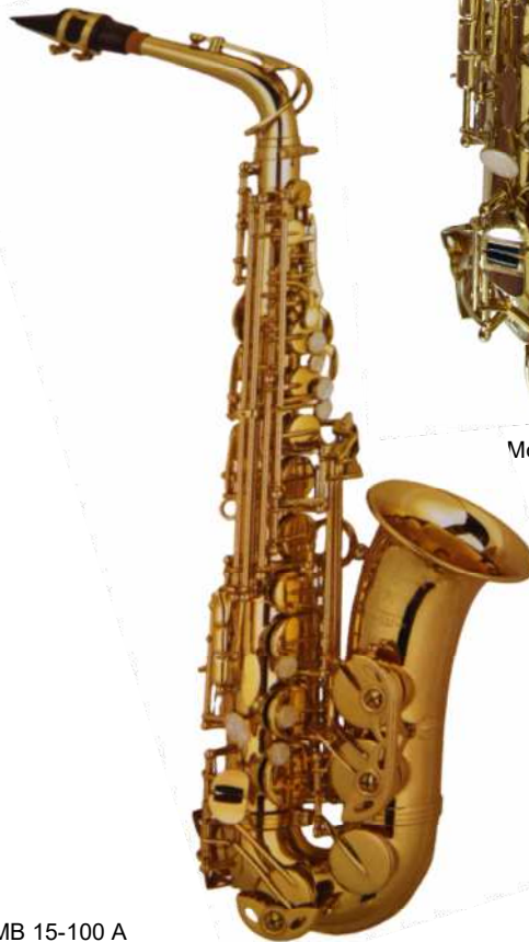
Modell TMB 15-100 A