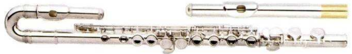
Modell TMB 15-120