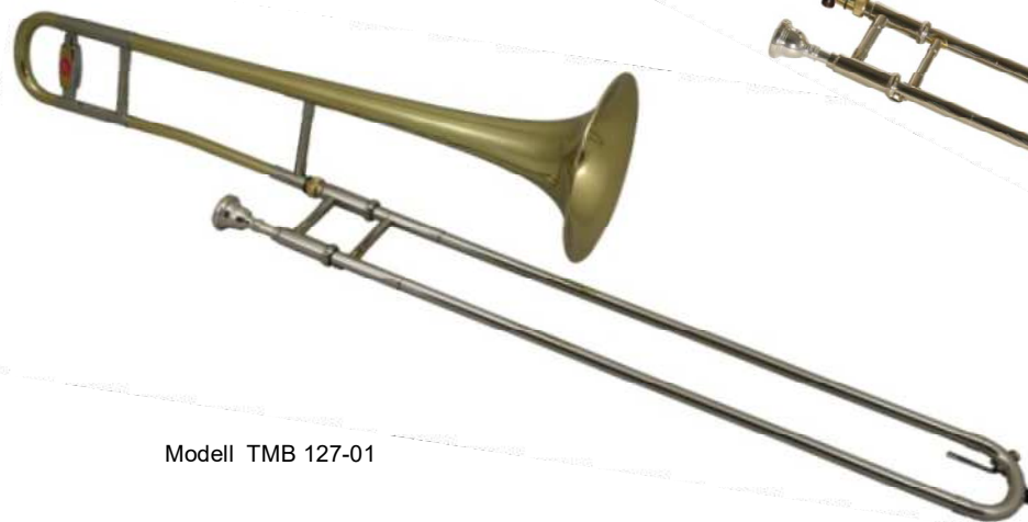
Modell TMB 127-01