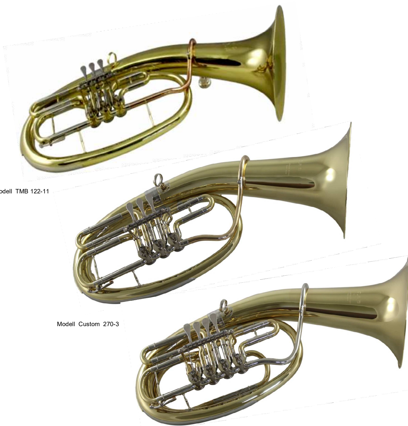
Modell Custom 270-4

4 Ventile, weit gebaut als Tenorhorn oder Bariton einsetzbar €uro 1.190,-