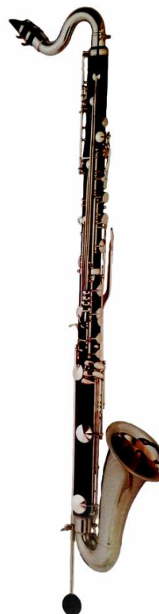
Modell TMB 15-600