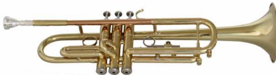
Modell TMB 1060

Bohrung 11,6 mm, Schallbecher Ø 123 mm, GM-Mundrohr, versetzte Stimmzüge, 3. Zug regulier- und verstellbar, Monelventile €uro 380,-