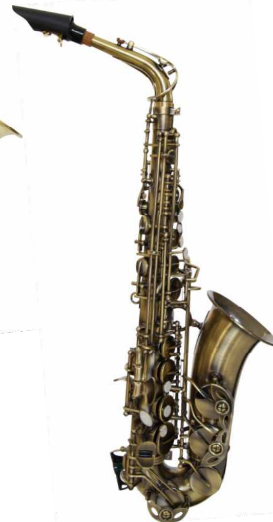
Modell TMB 15-200 AT