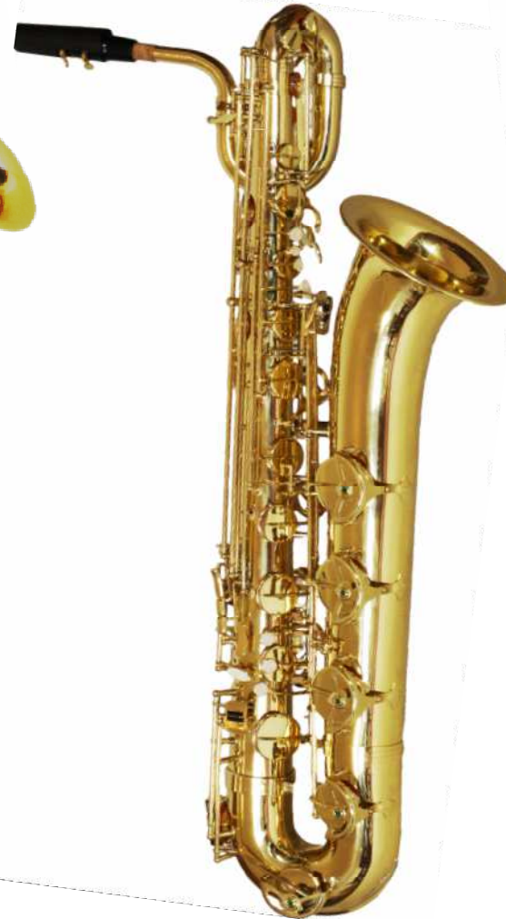
Modell TMB 15-600