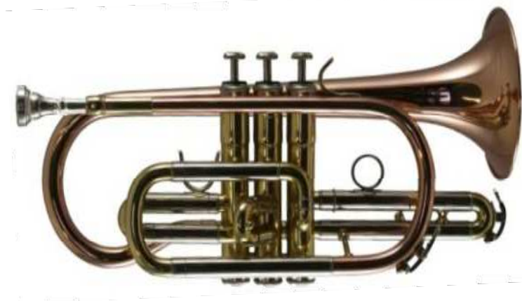
Modell TMB 561

franz. Bauart Bohrung 11,75 mm, Schall Ø 120 mm, Goldmessing-Schallstück und Mundrohr, Stahlventile handgeläpft €uro 495,-