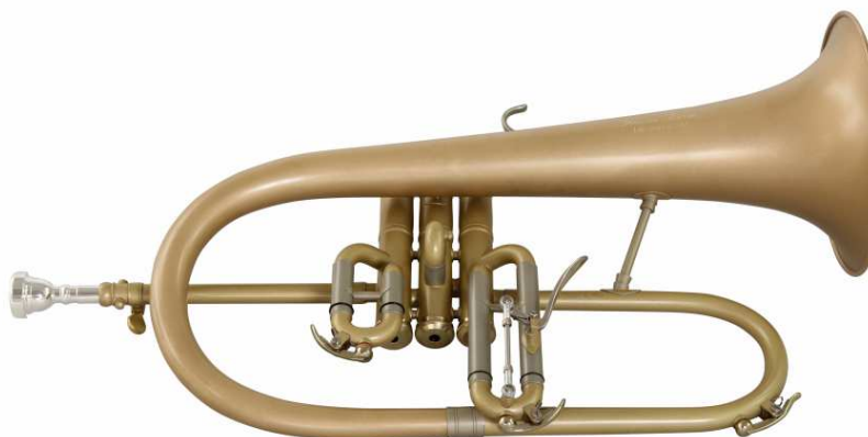
Modell Custom 300