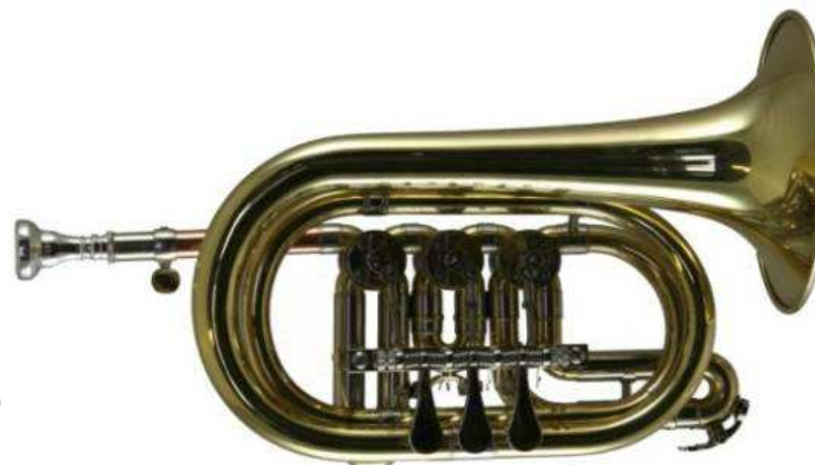
Modell TMB 1500

(Zylinderventil) deutsche Mensur Bohrung 11,65 mm, Schall Ø 130 mm, kurze Bauart €uro 460,-