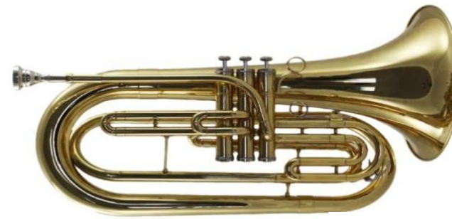
Modell TMB 170