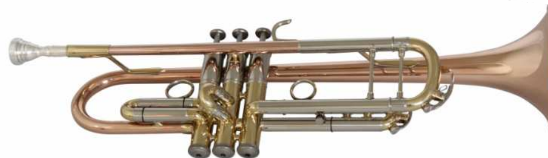
Modell Custom 1069

GM Ausführung, Reverse Mundrohr, lackiert. Bohrung 11,7 mm, Stahlventile, Schallbecher Ø 125 mm €uro 890,-