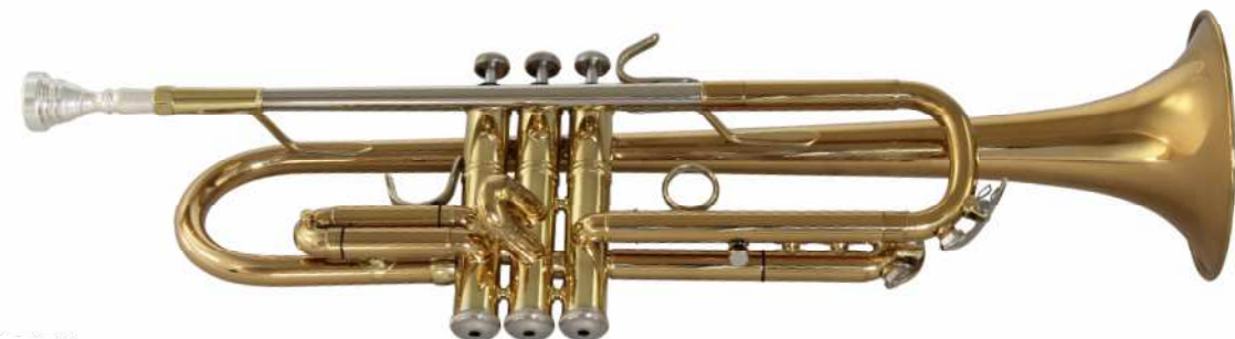
Modell Custom 1252

GM-Schallstück und Mundrohr, Daumensattel, NS-Züge, Stahlventile handgeläpft, zweiteiliges Ventilgehäuse. Bohrung 11,7 mm, Schallbecher Ø 125 mm €uro 520,-