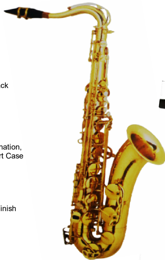
Modell TMB 15-100 T

wie Mod. 15-2000 T, jedoch Antique Gold Finish €uro 830,-