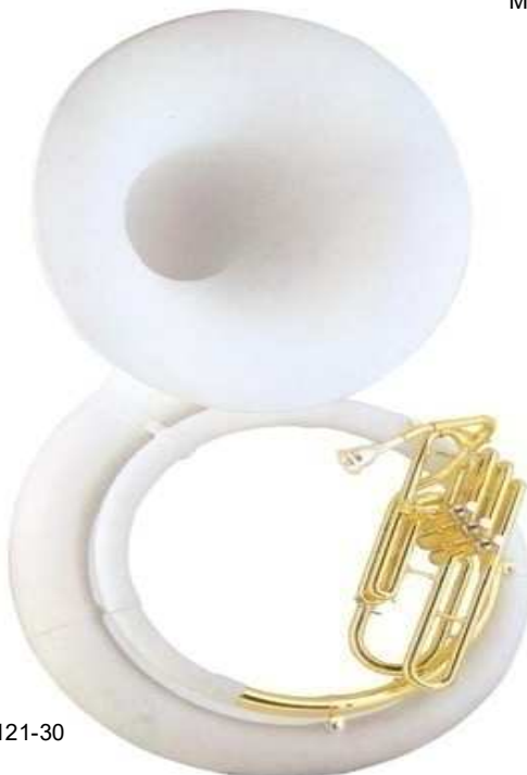
Modell TMB 121-30