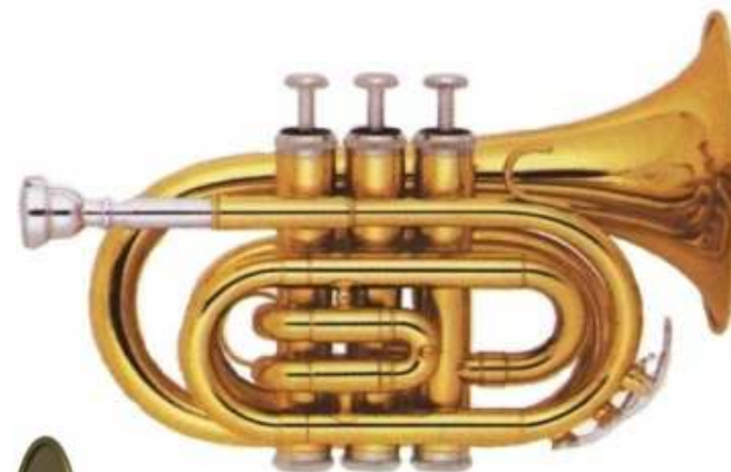
Modell TMB 1078

Bohrung 11,6 mm, Schall Ø 104 mm, Lupronickelventile €uro 190,-