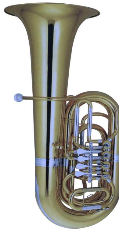
Modell TMB 122-20

3 Perinetventile Innenteil aus Messing mit Neusilber gefertigt, Korpus aus Fiberglas weiß, Neusilber-Züge, Becher Ø 660 mm, Bohrung 19 mm €uro 2.900,-