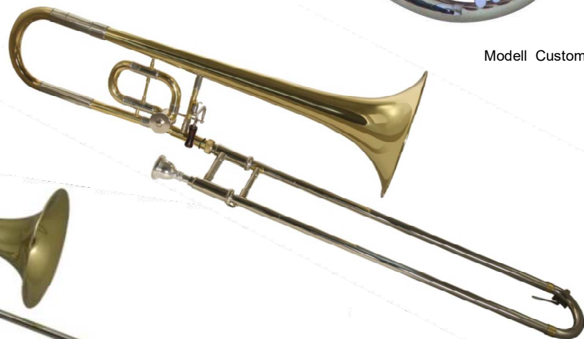
Modell TMB 684-12