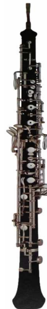
Modell TMB 15-110