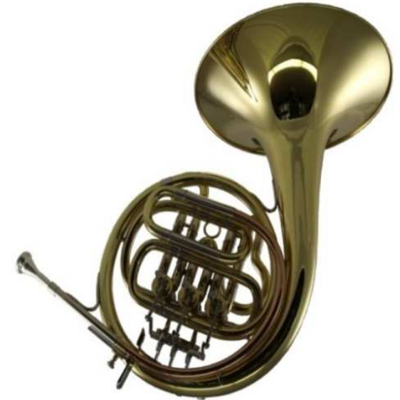
Modell TMB 146-31