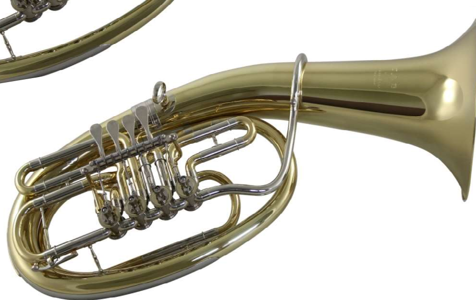
Modell Custom 270-4

4 Ventile, weit gebaut als Tenorhorn oder Bariton einsetzbar €uro 1.190,-