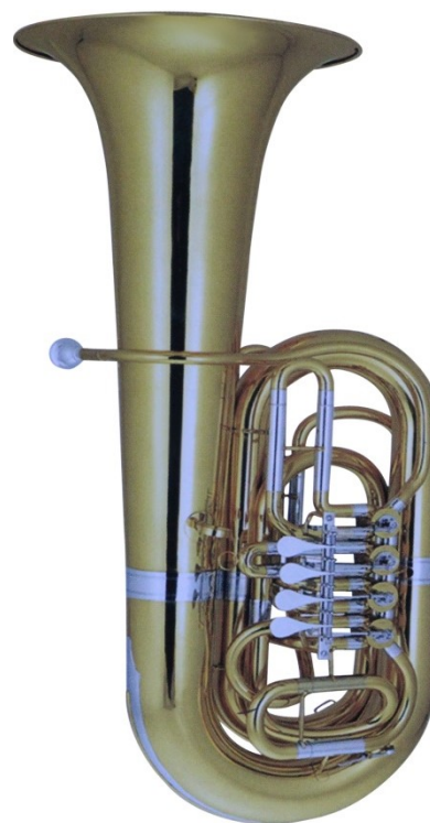
Modell TMB 122-20

3 Perinetventile Innenteil aus Messing mit Neusilber gefertigt, Korpus aus Fiberglas weiß, Neusilber-Züge, Becher Ø 660 mm, Bohrung 19 mm €uro 2.900,-