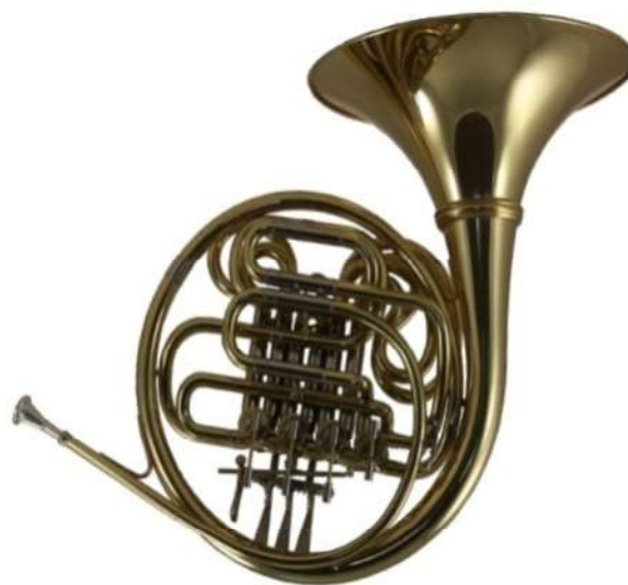
Modell TMB 146-42

4 Ventile, Bohrung 11,8 mm, Schall Ø 310 mm, abschraubbarer Becher auf Wunsch, umschaltbar von B auf F, Kugelgelenkmechanik €uro 1.280,-