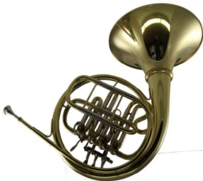
Modell Custom 146-41