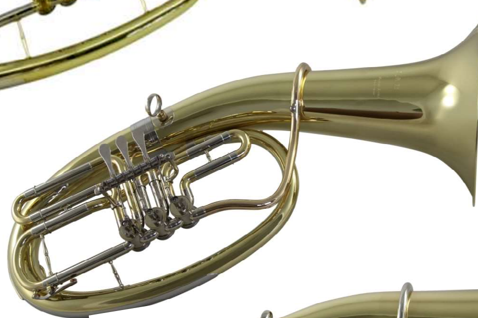
Modell Custom 270-3

3 Ventile, weit gebaut Bohrung 14 mm, Schall Ø 280 mm, Innen/Außenzüge Neusilber, NS-Ventilbuchsen, volles Tonvolumen, leichte Ansprache verstellbarer Daumenhalter €uro 1.060,-