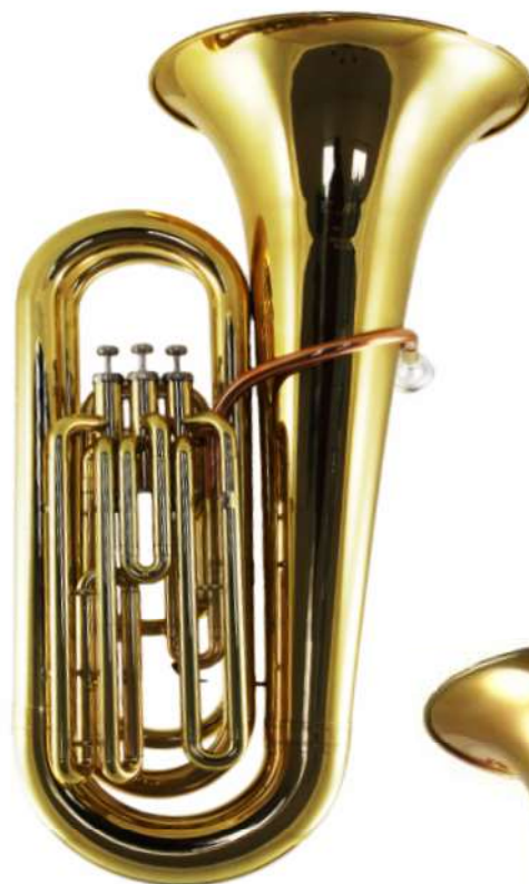
Modell TMB 125-10