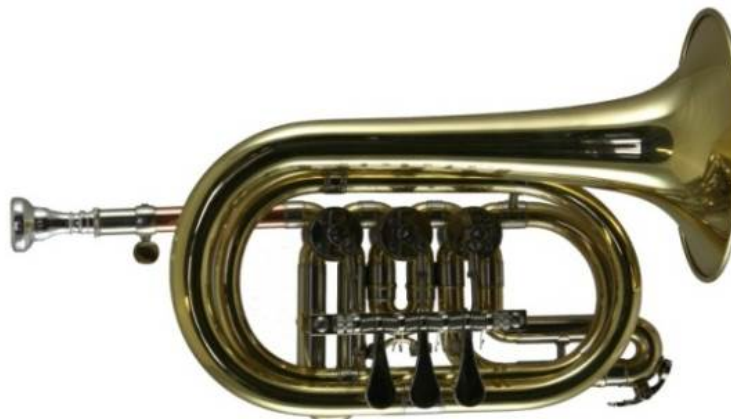
Modell TMB 1500

(Zylinderventil) deutsche Mensur Bohrung 11,65 mm, Schall Ø 130 mm, kurze Bauart €uro 460,-