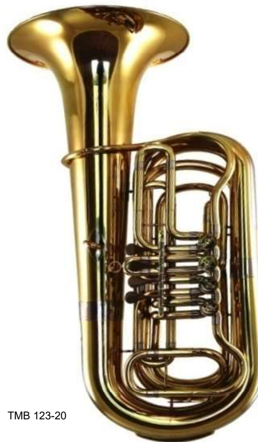
Modell TMB 123-20