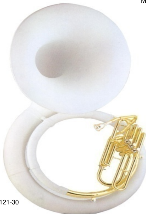
Modell TMB 121-30