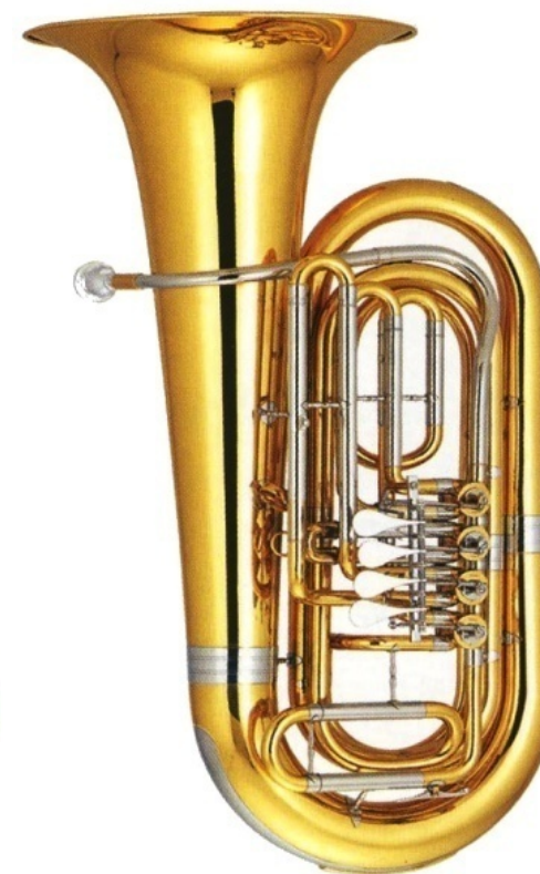
Modell TMB 125-00