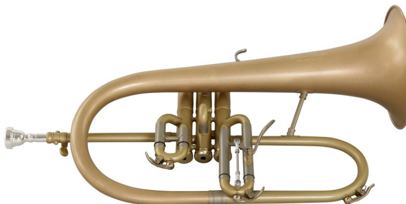
Modell Custom 300