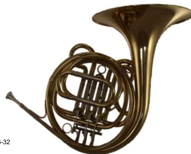
Modell TMB 146-32