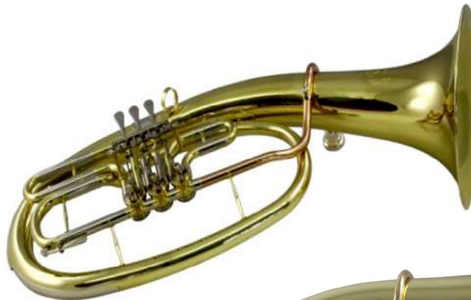
Modell TMB 122-11

ovale Bauart Bohrung 130 mm, Schall Ø 260 mm, NS-Züge, GM-Mundrohr, doppelte Kugelgelenke €uro 680,-