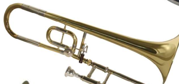
Modell TMB 684-12

Kindergerechter kürzer Zug, aus Neusilber, Innenzug mit Hartchrom, mit Umschaltventil Bohrung 13,34 Schall Ø 203 mm €uro 480,-