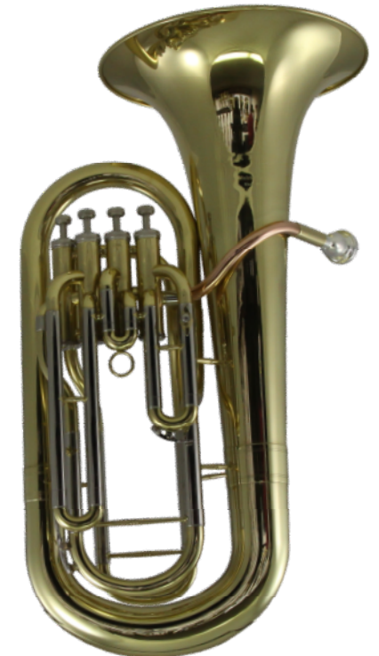
Modell TMB 108-15