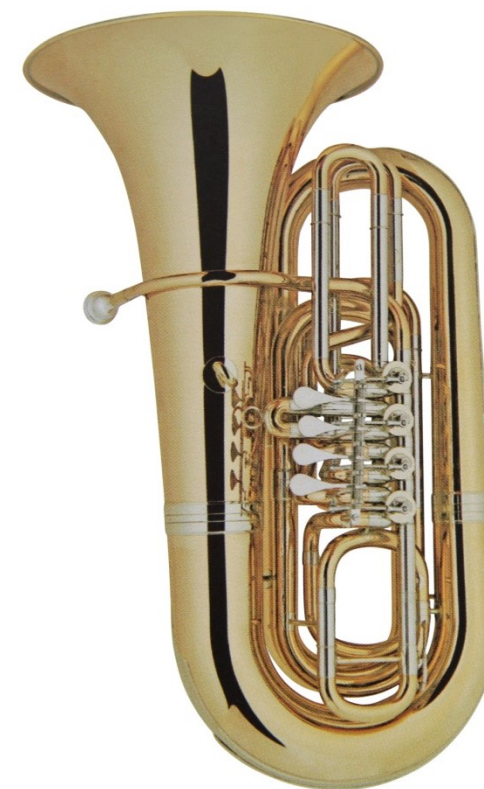
Modell Custom 300-30