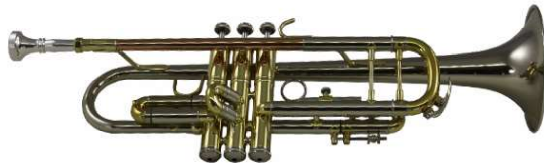
Modell Custom 1062