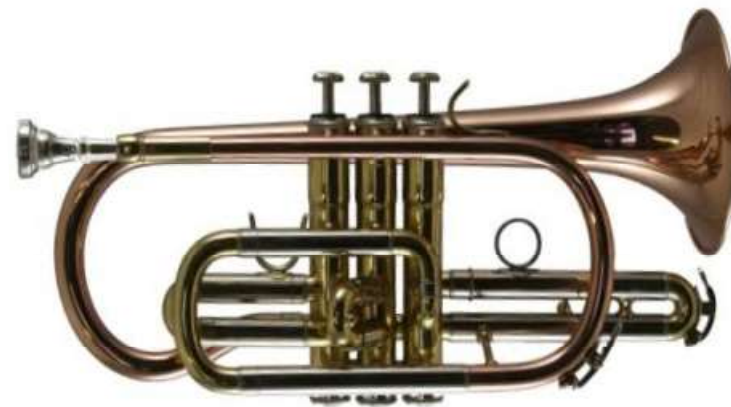
Modell TMB 561

franz. Bauart Bohrung 11,75 mm, Schall Ø 120 mm, Goldmessing-Schallstück und Mundrohr, Stahlventile handgeläpft €uro 495,-