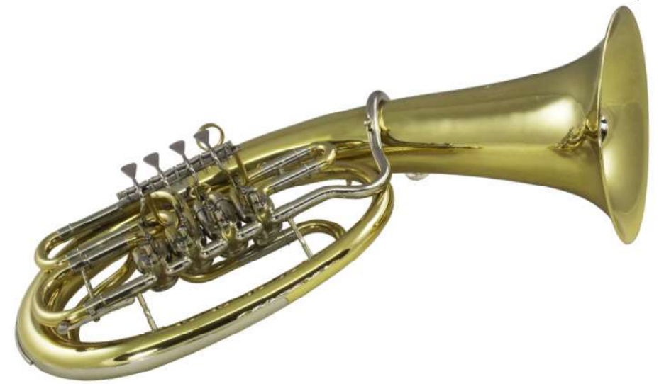
Modell TMB 121-60