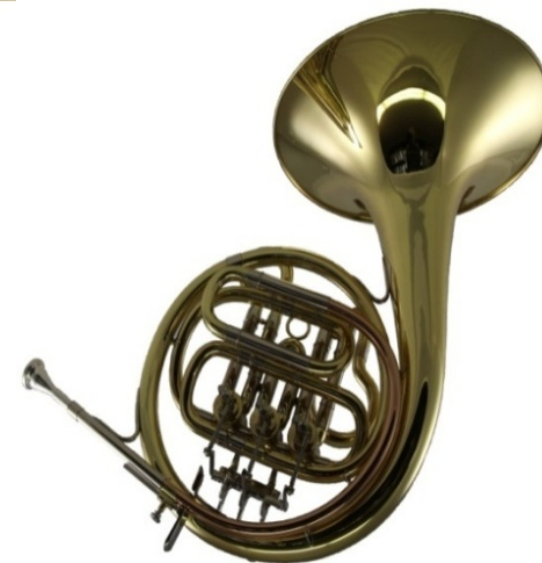
Modell TMB 146-31