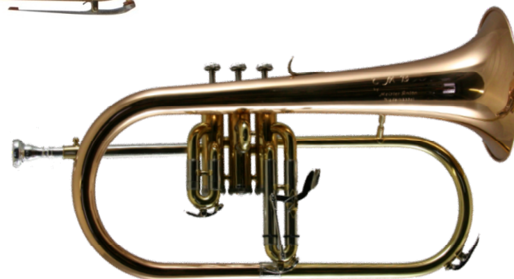
Modell TMB 278