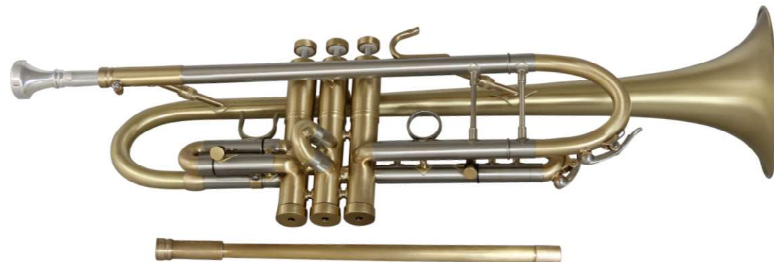
Modell Custom 1070