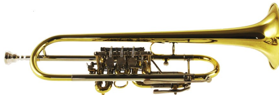
Modell TMB 2502