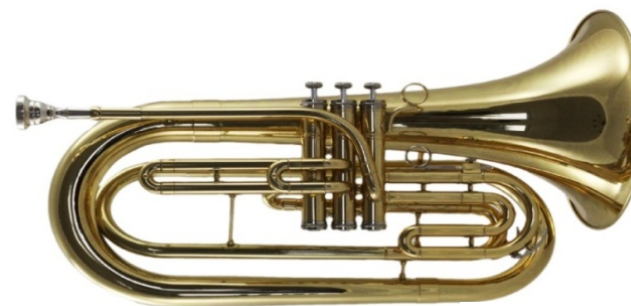
Modell TMB 170