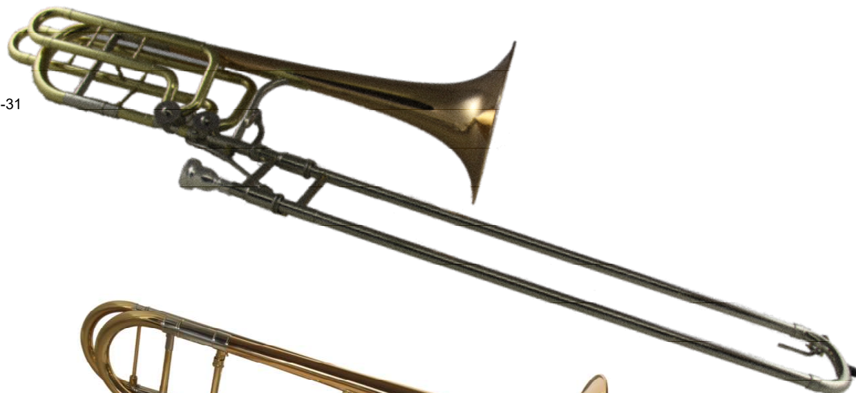
Modell Custom 128-12

Amerikanisches Modell B/F/Es oder F/D Bass-Posaune, Bohrung 14,3, Bronze-Schall Ø 250 mm NS-Innen und Außenzug mit Hartchromauflage €uro 1.190,-