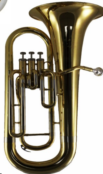
Modell TMB 108-15

Mit 4 Ventilen, Bohrung konisch von 15 auf 16, 8 mm verlaufend €uro 980,-