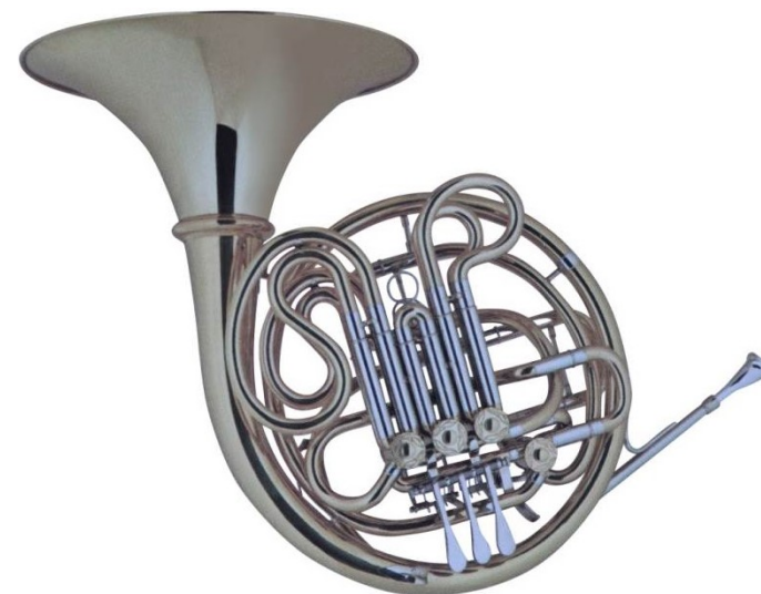
Modell Custom 10-832

Bewährtes handgehämmertes GM-Schallstück Becher Ø 310 mm, Bohrung 12 mm, abschraubbarer Becher auf Wunsch €uro 1.890,-