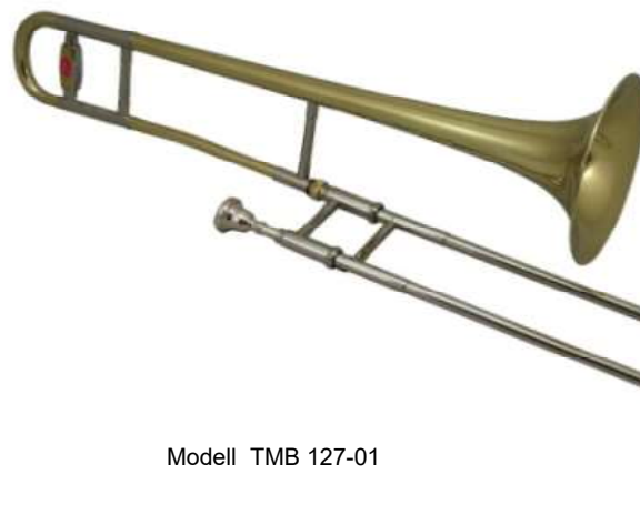
Modell TMB 127-01

Bohrung 12,7 mm, Schall ø 208 mm LW-NS-Innen- und Außenzug, Innenzug mit Hartchromauflage €uro 340,-