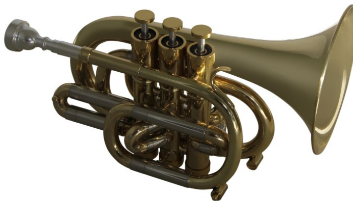
Modell Custom 15-408

Bohrung 11,7 mm, Schall Ø 125 mm, Monelventile €uro 380,-