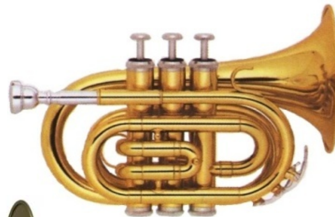
Modell TMB 1078

Bohrung 11,6 mm, Schall Ø 104 mm, Lupronickelventile €uro 190,-